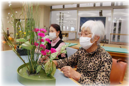
趣味活動を通じて楽しみながら活動の拡大をはかります。